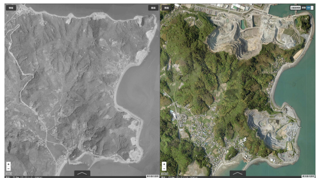
写真2 1960年代と現在の企救半島北部の空中写真 露天掘りにより山が階段状に大きく削られ、北部の太刀浦海岸では埋め立てが進んだことがわかる。